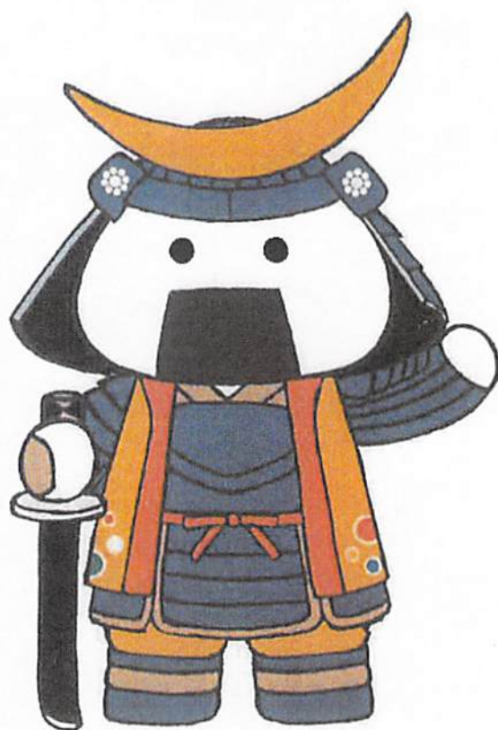
宮城県観光PRキャラクター むすび丸